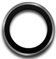
Vilber Fusion F/0.70