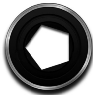
Other systems F/0.85